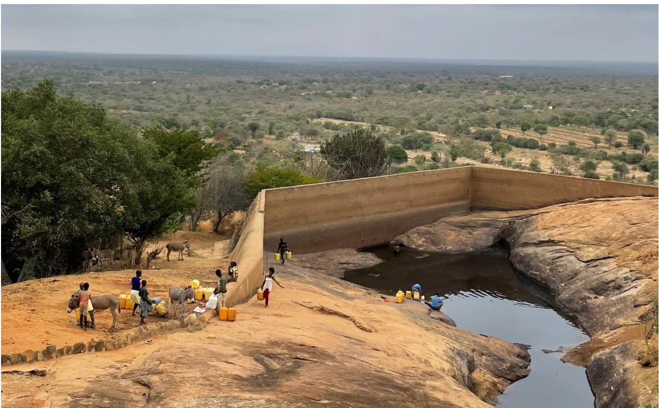
Kvinnorna fick gå långt för att hämta vatten i den mer eller mindre uttorkade dammen.